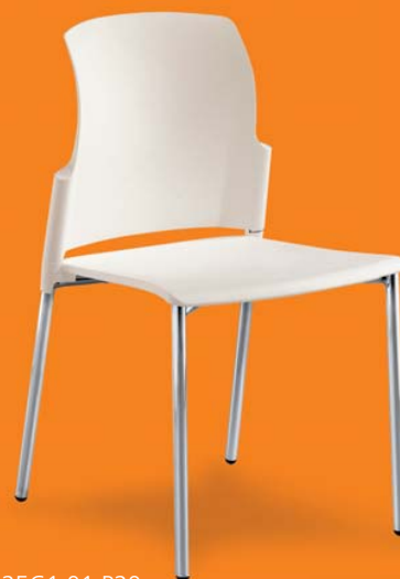
25C1 01 P20