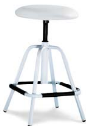
1202 12, 26 418 ■ výška sezení 56-73 cm