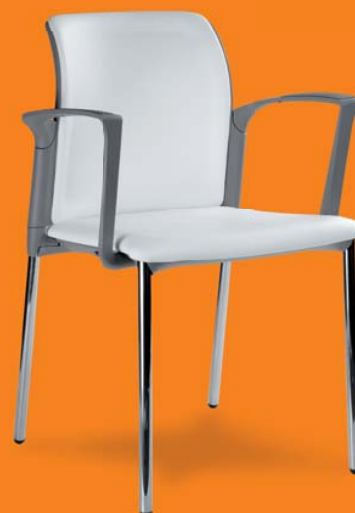
25C1 01 P17 A, RP1+RS1 26 418