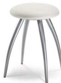
1163 08, 26 418 ■ výška sezení 45 cm