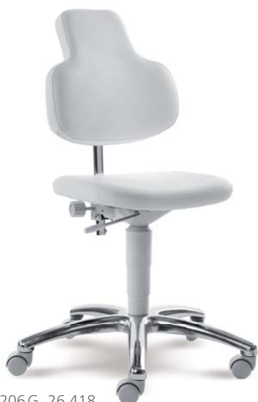
2206 G, 26 418 ■ multifunkční židle MED MAX ■ standardně měkká kolečka

Barva kostry na přání světle šedá RAL 7035 nebo černá. Velký výběr čalounění v PVC nebo PU koženkách, látkách, mikroplyších nebo kůžích. Bezpečnostní pojezdová kolečka tvrdá na koberce, na přání měkká nebo kluzáky.