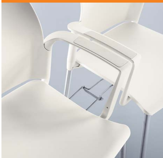
detail spojování do řady