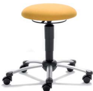
1250 08 RI, 26 419 ■ výška sezení 44-56 cm ■ za příplatek VP 54-74 cm