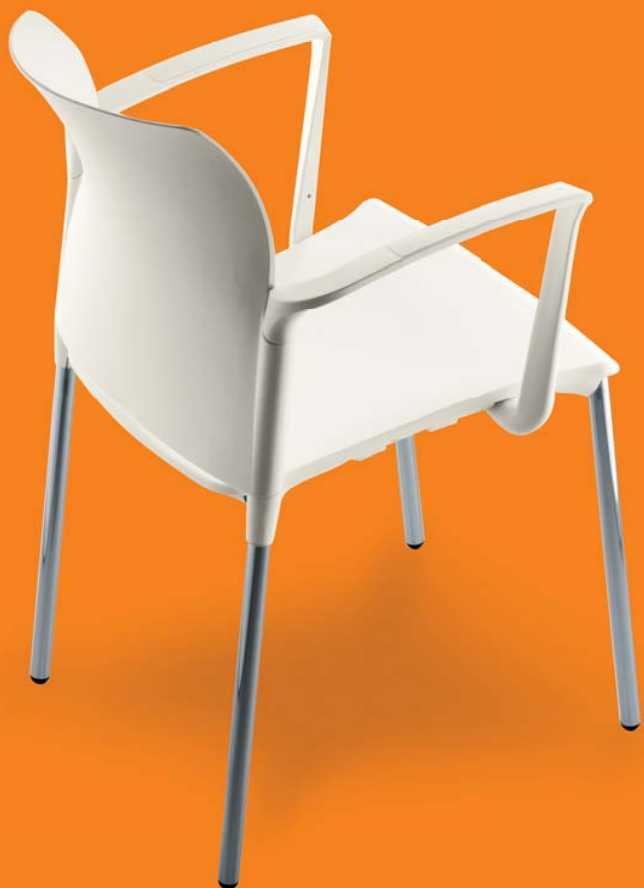
25C1 01 A P20