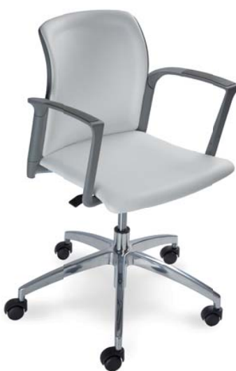
24C0 C P17 A, RS1+RP1 26 418 návštěvní židle vč. lavic do čekáren na straně 6 a 7