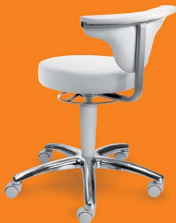
1251 G med, 26 418 ■ výška sezení 45-55 cm