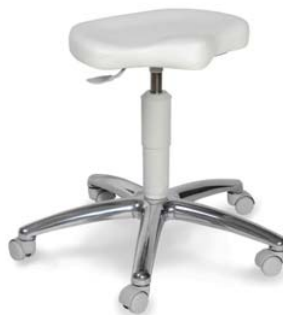
1257 G, 26 418 ■ výška sezení 43-55 cm ■ za příplatek VP 53-73 cm