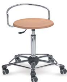
1254 61 91 ■ výška sezení 54-74 cm ■ standardně měkká kolečka