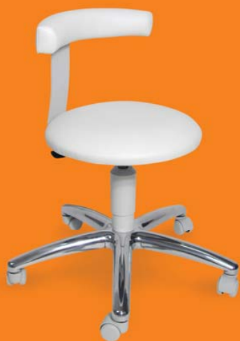
1253 G, 26 418 ■ výška sezení 43-55 cm