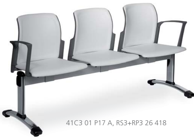
41C3 01 P17 A, RS3+RP3 26 418