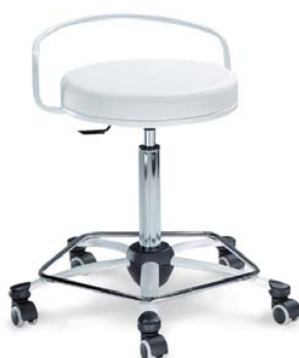
1254 62, 26 418 ■ výška sezení 54-74 cm ■ standardně měkká kolečka