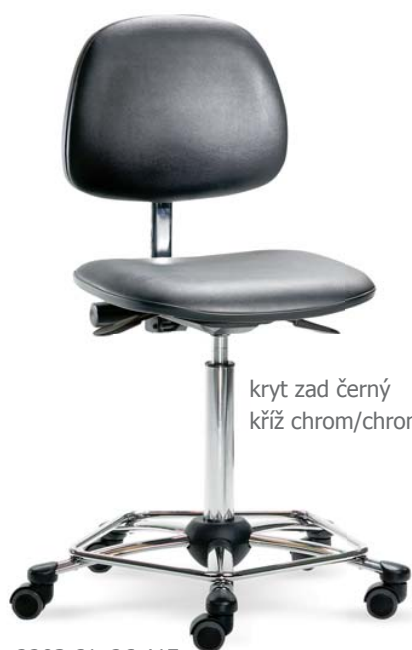
kryt zad černý kříž chrom/chrom