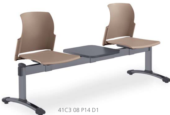
41C3 08 P14 D1