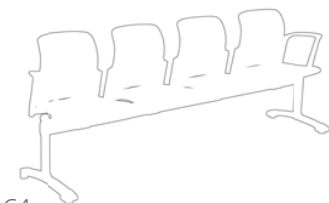
41C4 délka 250 cm