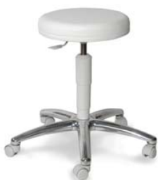
1256 G, 26 418 ■ výška sezení 46-58 cm, ■ za příplatek VP 56-76 cm