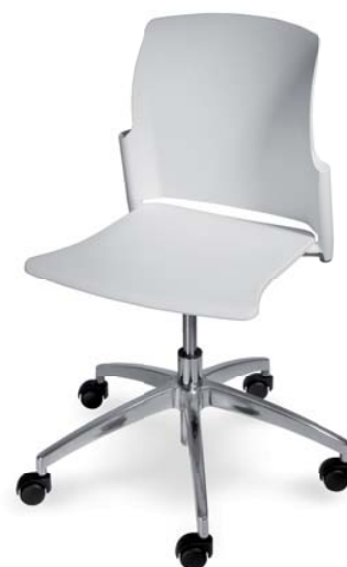
24C0 C P20