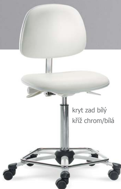
kryt zad bílý kříž chrom/bílá