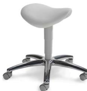
1207 G, 26 418 ■ výška sezení 45-57 cm ■ za příplatek VP 55-75 cm