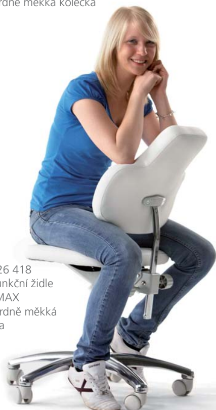
2206 G, 26 418 ■ multifunkční židle MED MAX ■ standardně měkká kolečka