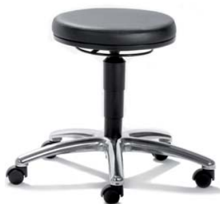
1256 S RI, 26 417 ■ výška sezení 46-58 cm, ■ za příplatek VP 56-76 cm ■ kruhový ovladač pístu