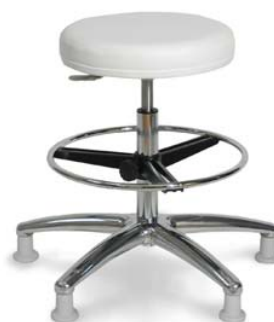
1205 G, 26 418 ■ výška sezení 54-74 cm ■ standardně kluzáky