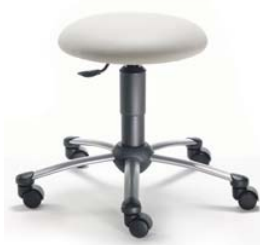
1250 08, 26 418 ■ výška sezení 44-56 cm ■ za příplatek VP 54-74 cm