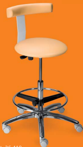
1253 G dent, 26 419 ■ výška sezení 53-73 cm