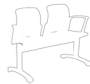
41C2 délka 127 cm