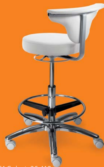
1251 G dent, 26 418 ■ výška sezení 57-77 cm