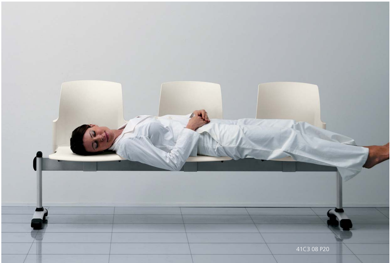
41C3 08 P20