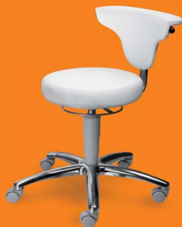
1251 G med, 26 418 ■ výška sezení 45-55 cm