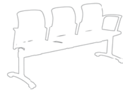
41C3 délka 189 cm