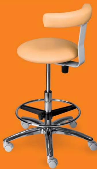
1253 G dent, 26 419 ■ výška sezení 53-73 cm