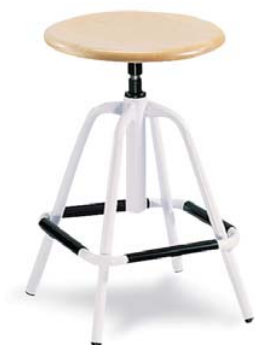
1202 12 91 ■ výška sezení 56-73 cm