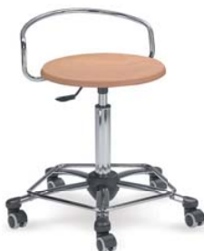
1254 61 91 ■ výška sezení 54-74 cm ■ standardně měkká kolečka