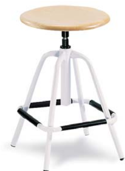
1202 12 91 ■ výška sezení 56-73 cm