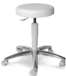
1256 G, 26 418 ■ výška sezení 46-58 cm, ■ za příplatek VP 56-76 cm